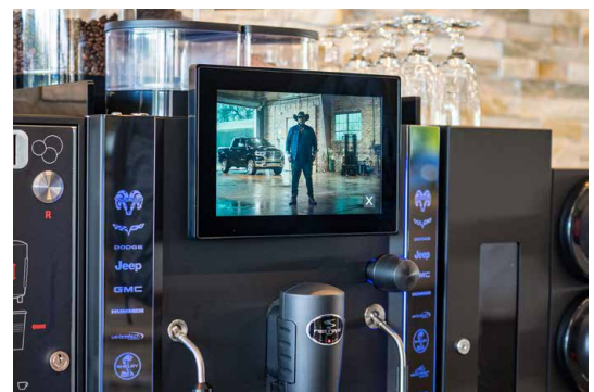
Die neue IoT-Solution «Rex-Royal Cloud» analysiert Daten in Echtzeit. Diese sind standortunabhängig abrufbar und helfen Abläufe zu optimieren, Servicekosten zu senken und Trends zu erkennen.