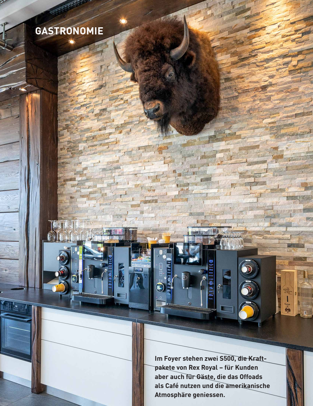
Im Foyer stehen zwei S500, die Kraftpakete von Rex Royal – für Kunden aber auch für Gäste, die das Offroads als Café nutzen und die amerikanische Atmosphäre genießen.