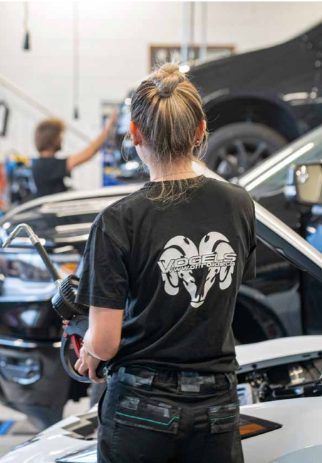
Das Offroads beschäftigt 30 Mitarbeitende, ein Drittel davon sind Frauen. Eine Mechatronikerin hat soeben ihre Lehre abgeschlossen.