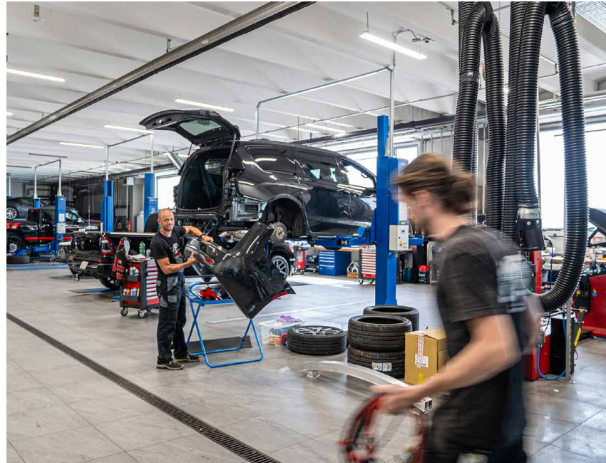
In der hauseigenen, professionell eingerichteten Garage arbeitet ein versiertes Team und erbringt Service- und Reparaturarbeiten an US-Cars.